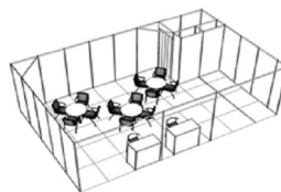
Sl. 1. Izgrađen prostor